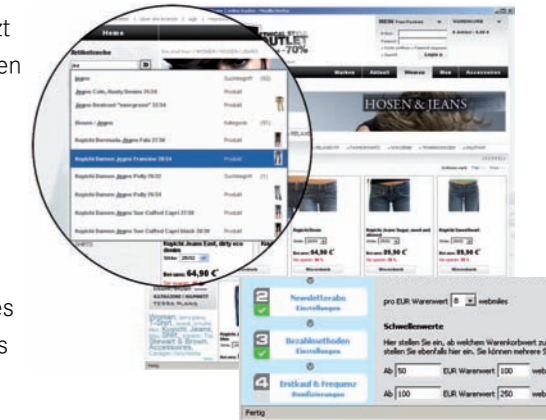
Best Practice Integration für OXID eShop

Jeder Service kann in wenigen Schritten aktiviert werden. Ein Workflow unterstützt Sie mit allen relevanten Informationen, Vertragsunterlagen, sowie mit Moduldateien oder Templates für den Shop.