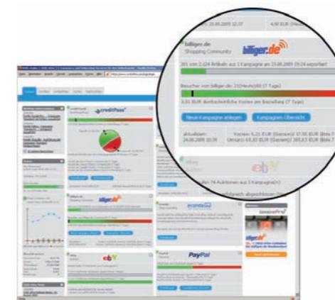
Alles im Blick - das OXID eFire Cockpit